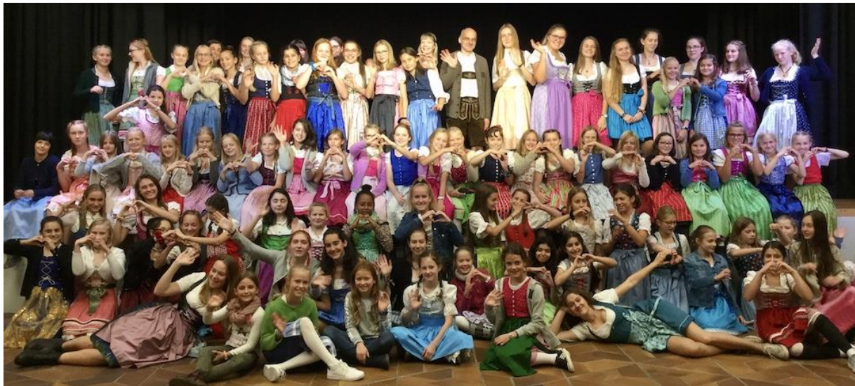
Informationsabend zum Übertritt in die 5. Klasse